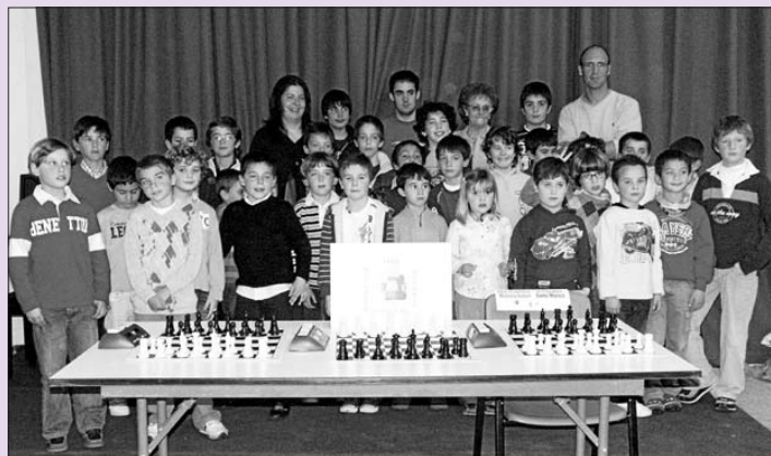
Los equipos del Mallorca Isolani y del colegio Santa Mónica antes de su amistoso.

Buenas noticias nos llegan desde Calvià, pues se ha confirmado la cele-