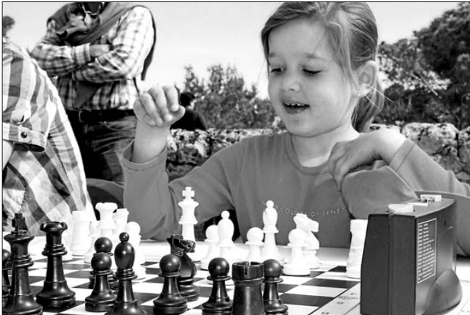
Una de las participantes más jóvenes en esta lúdica jornada.