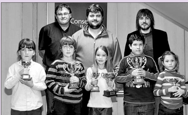
Imagen del podio del Torneo Escolar sub'8.

Como dato curioso, el Algaida no perdía en su terreno desde el 19 de marzo de 2005 y en aquella ocasión lo hizo frente al desaparecido CFAM de Martrixí.