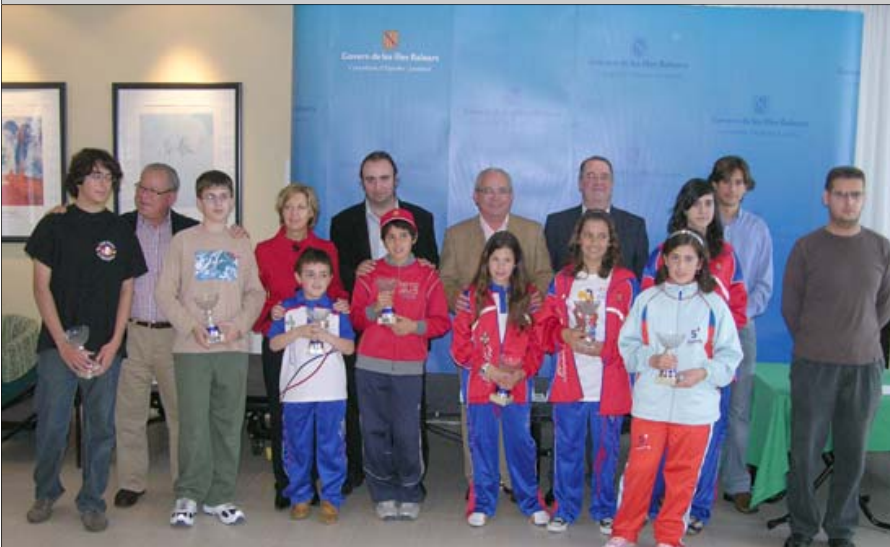
Campions de Balears per categories