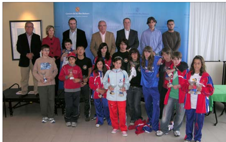
Primers classificats de la general